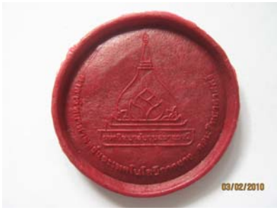
ภาพที่ 4 จานรองแก้วที่ทำมาจากพลาสติกชีวภาพ : กลูเทนต่อกลีเซอรอลในอัตราส่วน 95:5 เปอร์เซ็นต์โดยน้ำหนัก

ที่ 95:5 เปอร์เซ็นต์โดยน้ำหนัก มาผสมสีก่อนให้เกิดความสวยงาม และทำการขึ้นรูปด้วยเครื่อง Compression Molding และแม่พิมพ์สำหรับการทำงานรองแก้ว ดังภาพที่ 4