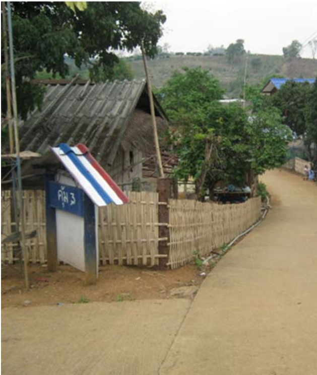
ภาพที่ 1 สภาพทั่วไปของหมู่บ้านสิบสองพัฒนาใหม่

ควบคุมให้มาอยู่รวมกันที่ศูนย์ควบคุมผู้อพยพหลบหนีเข้าเมือง บ้านน้ำยาว อำเภอปัว จังหวัดน่าน ซึ่งอยู่ภายใต้การช่วยเหลือของ สำนักงานข้าหลวงใหญ่ผู้ลี้ภัยแห่งสหประชาชาติ (UNHCR) ก่อนที่ ชาวม้งส่วนหนึ่งจะเดินทางไปยังประเทศที่สาม เช่น สหรัฐอเมริกา ฝรั่งเศส ออสเตรเลีย และอังกฤษ ในส่วนของชาวม้งที่ไม่ได้เดินทางไปต่างประเทศได้อพยพมาอยู่ที่หมู่บ้านสิบสองพัฒนาใหม่ (ภาพที่ 1)