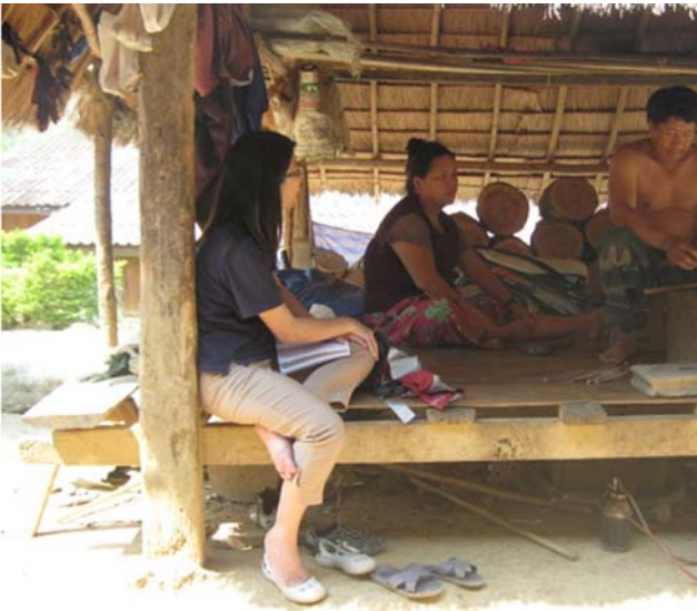
ภาพที่ 2 ชาวบ้านกำลังดีเครื่องเงินเพื่อทำเป็นเครื่องประดับส่งไปให้ญาติที่อยู่ต่างประเทศ