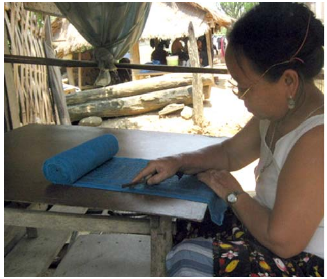
ภาพที่ 3 หญิงสูงอายุชาวมังกำลังจดจ่ออยู่กับการเขียนลายผ้าด้วยเทียนเหลว