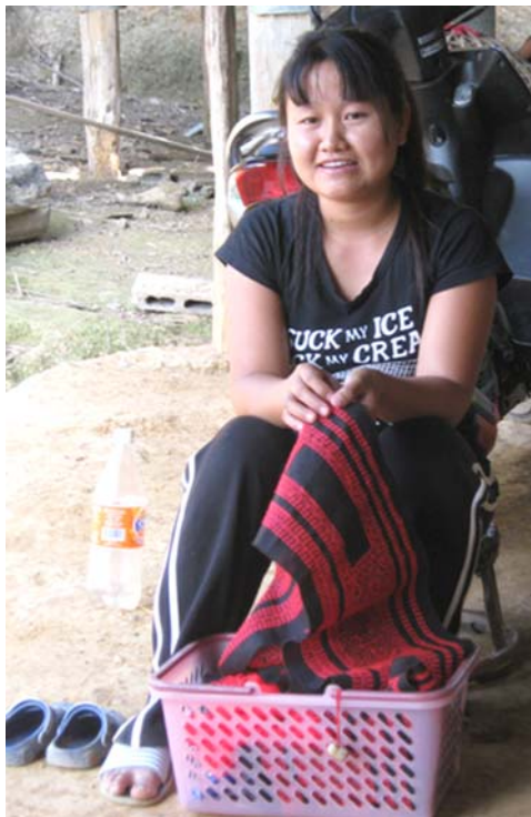
ภาพที่ 4 ภาพหญิงชาวมังนั่งปักผ้าเป็นสิ่งที่พบเห็นกันทั่วไปในหมู่บ้าน