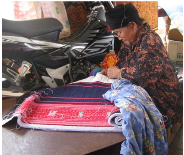
ภาพที่ 5 หญิงชราชาวมังกำลังสาละวนกับการจับจีบผ้าม้งที่ปักเสร็จแล้ว

ชาวมังบ้านสิบสองพัฒนาใหม่ทุกครัวเรือน มีญาติอยู่ในต่างประเทศจึงสามารถส่งสินค้าไปจำหน่ายให้กับเครือญาติและชาวมังคนอื่นๆ ได้ โดยสินค้าที่ได้รับความนิยมมากที่สุดคือเสื้อผ้าม้งสำเร็จรูป ซึ่งหญิงชาวมังสามารถทำได้ทุกคน จึงเป็นอาชีพเสริมที่ทำรายได้ให้กับครอบครัว โดยเฉลี่ย 1 ปี หญิงชาวมังจะสามารถปักผ้าได้ 2-3 ผืน โดยใช้เวลารว่างจากการทำไร่มาปักผ้า (ภาพที่ 3, 4 และ 5)