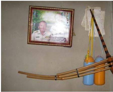
ภาพที่ 6 "แคนม้ง" เครื่องดนตรีสำคัญประจำเผ่าม้ง

สำหรับแคนนั้น ในหมู่บ้านสิบสองพัฒนาใหม่ มีชาวบ้านที่สามารถทำแคนได้ 2 ครอบครัว โดยวัตถุดิบที่ใช้ทำแคนซึ่งก็คือไม้หอมนั้น จะต้องสั่งมาจากประเทศลาว (ภาพที่ 6)